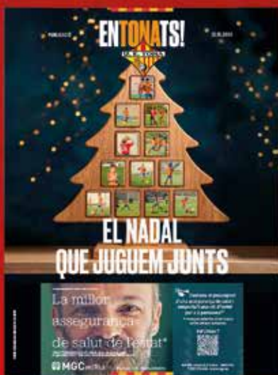
El nadal que juguem junts — Entonats 05 —