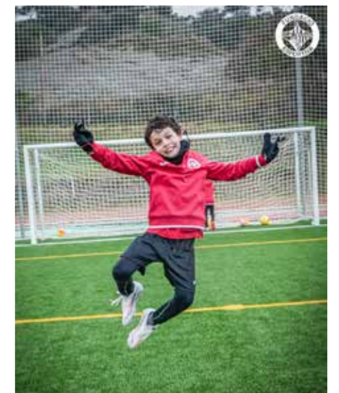
Celebració d'un gol durant el campus de Nadal.