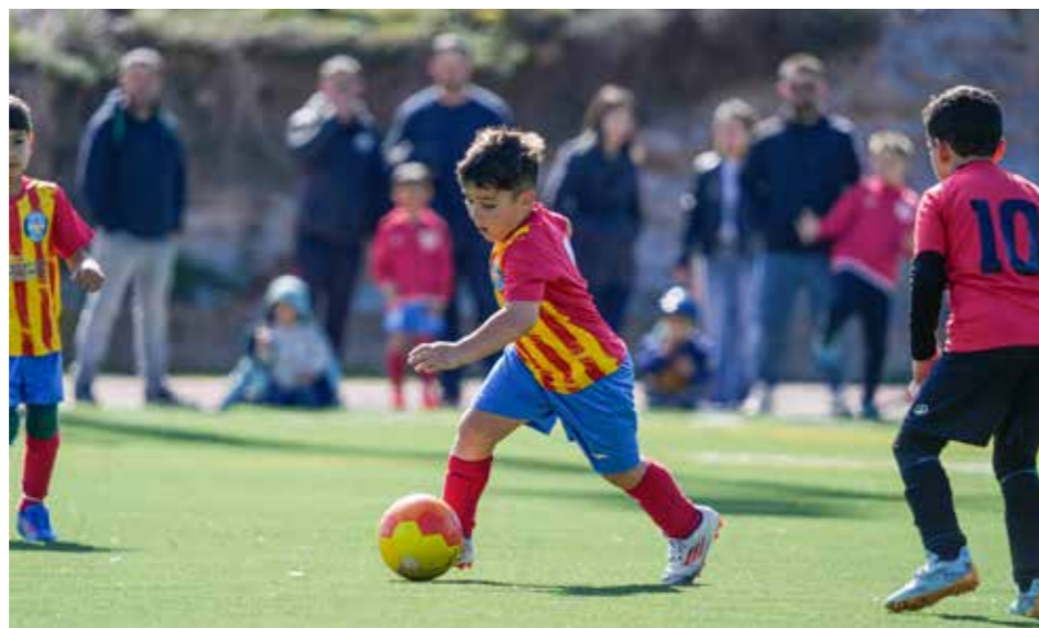
Un futbolista del Prebenjamí S7 amb la pilota controlada.