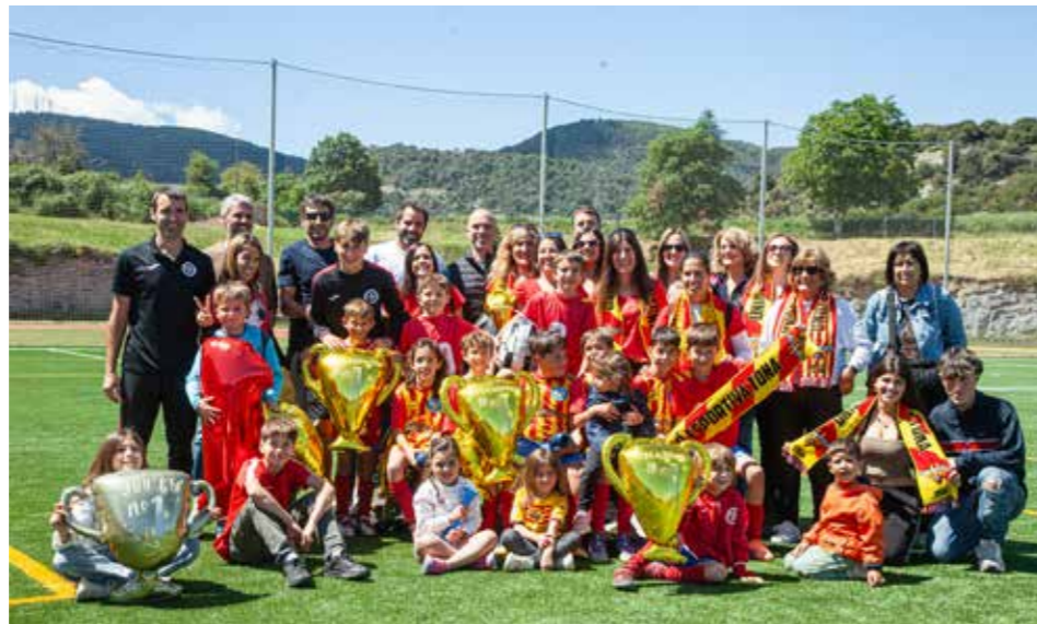
Celebració del títol de lliga del Benjamí S9A.

També tanquem l'any sent l'equip menys golejat amb vint-i-nou gols en contra, deu menys que el següent classificat i, ofensiva-