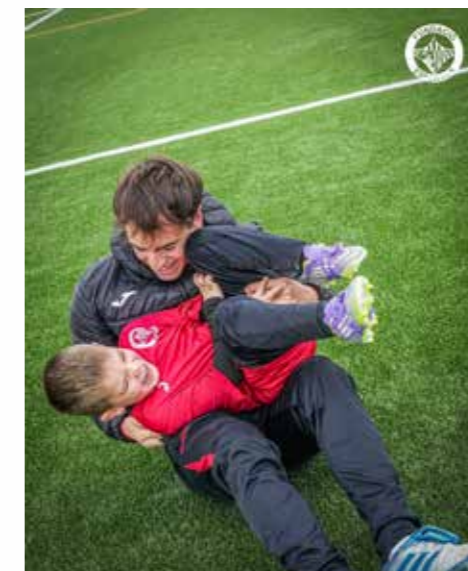
Entrenador i jugador durant el campus de Nadal.