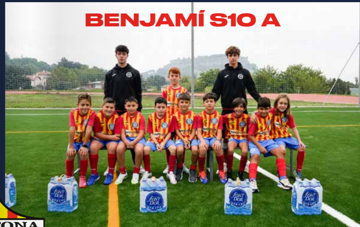
BENJAMÍ S10 A