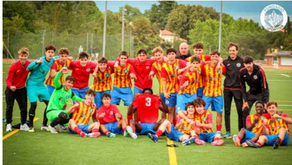
El Juvenil A celebrant la salvació.

Per altra banda, l'Aleví S12A i el Benjamí S10A són dues generacions que els ha costat més. “A l'etapa aleví no hem salvat la categoria, però ho hem intentat amb il·lusió i esforç, mentre que amb l'etapa benjamí hi ha hagut diversos canvis d'entrenadors i això no ha afavorit al desenvolupament dels nens i nenes. M'agradaria fer autocrítica amb la gestió d'aquestes dues generacions. Des de coordinació ho podríem haver fet millor i volem aprendre dels errors per a les properes temporades”. La sensació amb la resta d'equips de Futbol 7 és bona. “Tenim generacions de qualitat i salut al club. El Tona li espera un gran futur”.