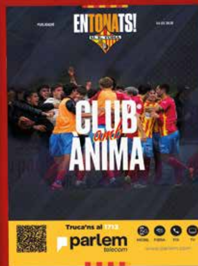
Club amb ànima — Entonats 06 —