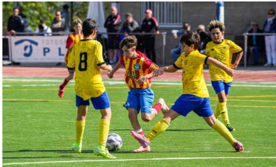
El capità de l'Infantil S13 rodejat de rivals.