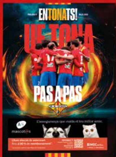
Pas a pas — Entonats 01 —