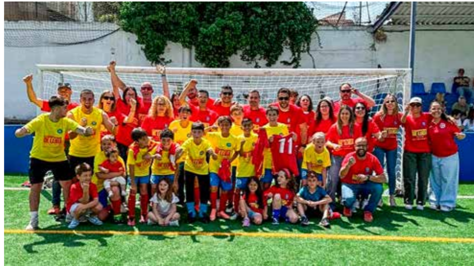
L'Aleví S11A celebrant l'ascens a Primera Divisió.

A nivell col·lectiu, estic molt satisfet amb