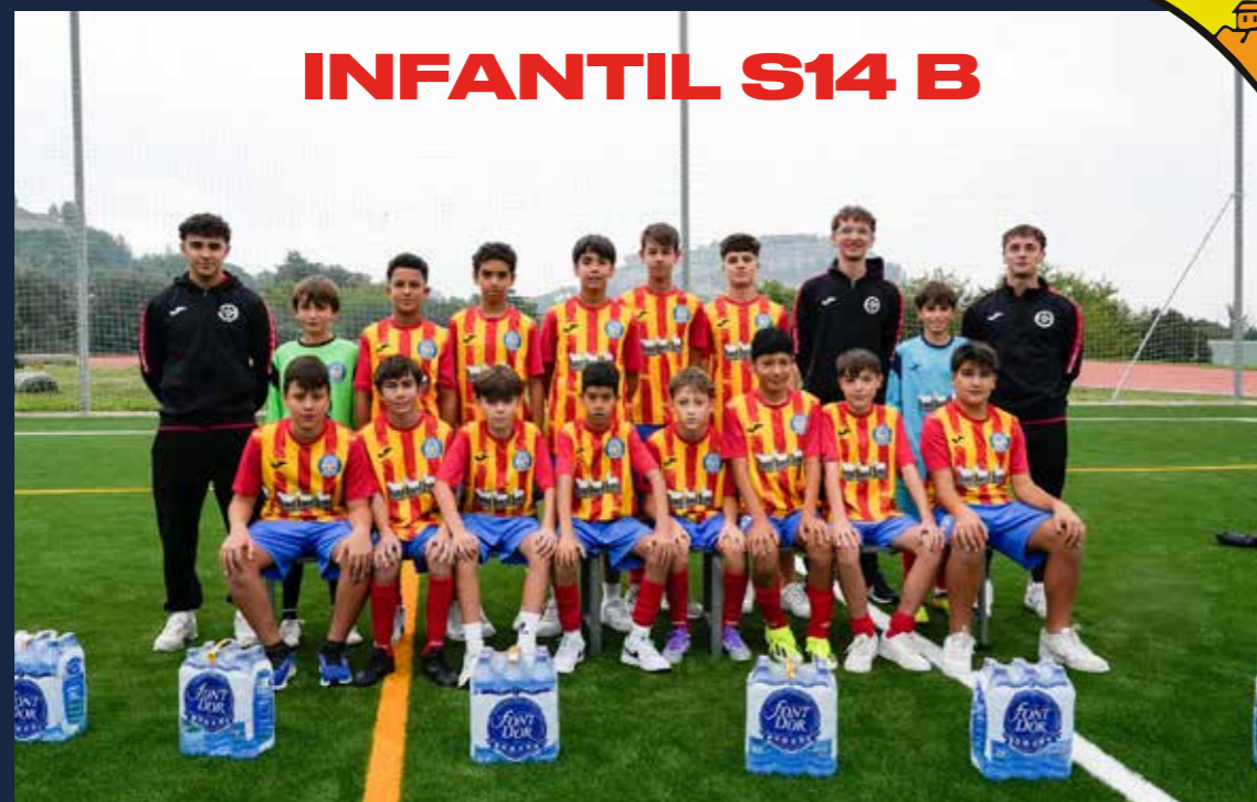
INFANTIL S14 B