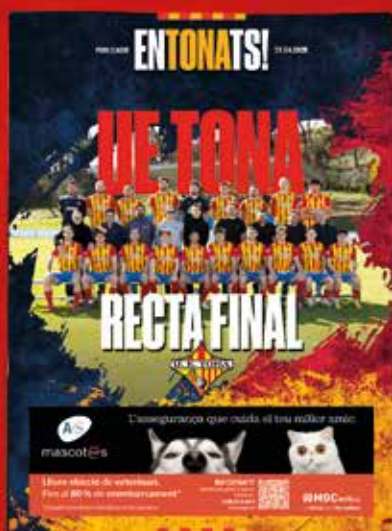
Recta final — Entonats 02 —