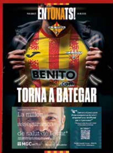
Torna a bategar — Entonats 04 —